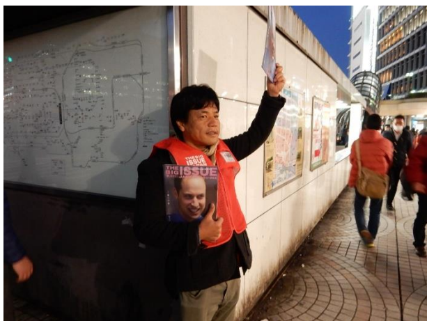
フィールドワーク 「道端留学：ビッグイシュー販売サポート」【東京会場】