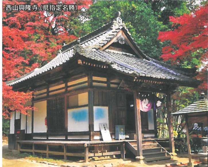
西山興隆寺 (県指定名勝)