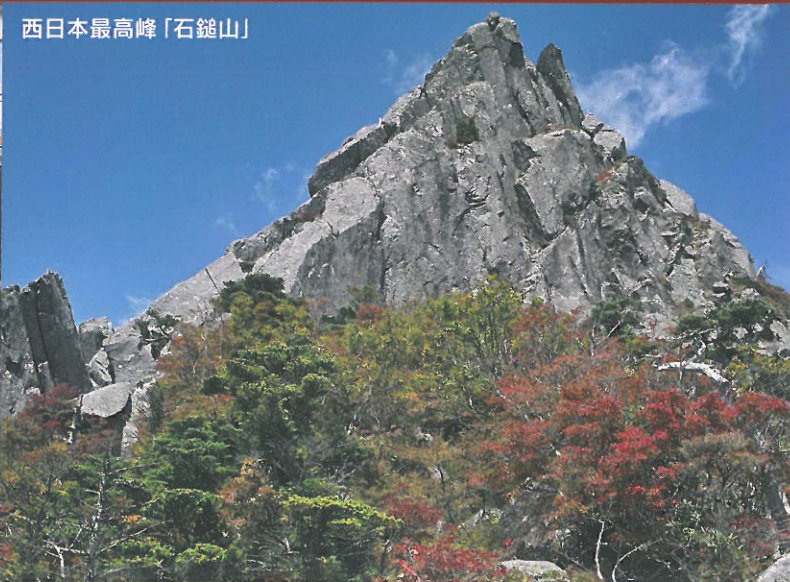
西日本最高峰「石鎚山」