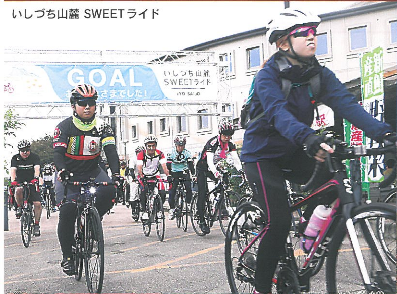
いしづち山麓 SWEETライド