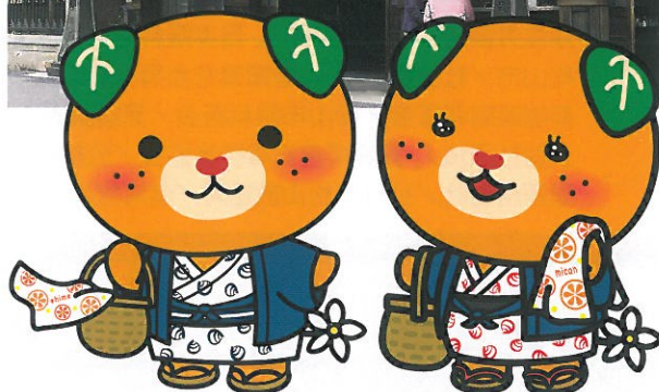
愛媛県イメージアップキャラクター みきやん 許諾番号 2909034