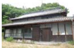
▲古民家(尾形の御堂家)