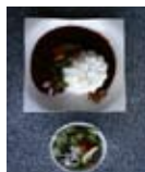
▲遠見茶屋の能島海賊カレー