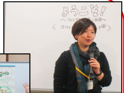
←ファシリテーショングラフィック講座の進め方をグラフィックにしてみました