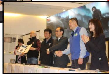
顕彰活動連携のための調印式の様子→