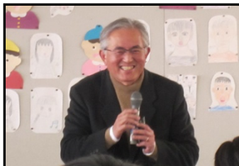
←シンポジウムの様子

松山市久米地区で、いろいろな人と出会いふれあうことをコンセプトとした「ふれあい食堂」を開設、運営協力をしている。 平成30年2月には、これまでの成果の発表の場として、シンポジウムを開催し、ふれあい食堂開設までの道のり、開設後の支援状況、学生等ボランティアの状況等について発表があった。関係者等87名が参加した。 (助成額:500,000円)