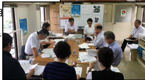
←空き家特別委員会の様子