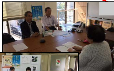
空き家相談の様子→

平成26年度より空き家対策事業に取り組んでおり、県・県内20市町・県内関係団体と連携している。「空き家相談室」を開設し、問題解決のために必要な知識を持つメンバーが様々な事例の相談に応じている。 助成事業期間中(H29.8.1~H30.3.1)には、22件の相談があり、問題解決に取り組んでいる。 (助成額:500,000円)