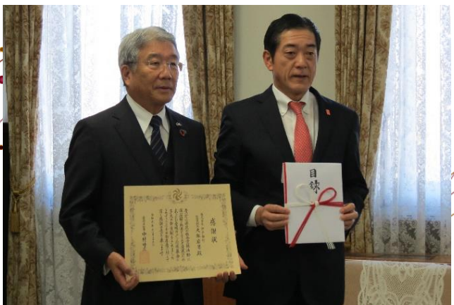
11月26日 伊予銀行株式会社 様