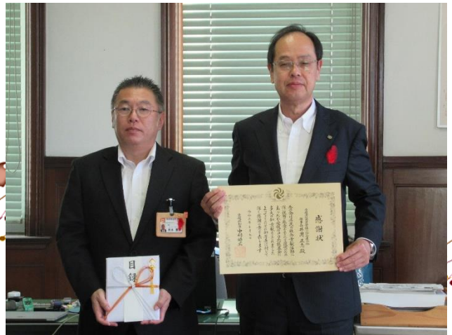
10月9日 愛媛県信用農業協同組合連合会 様