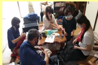
引き取った商品の補修