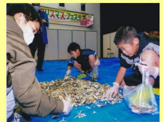
イベントでの様子

〔（左）手作りランタンといりこクイズラリー （右）いりこモンスターを探せゲーム〕