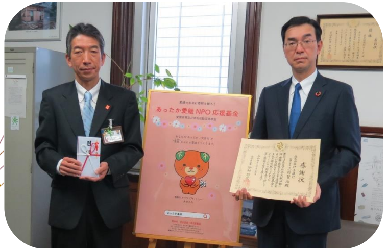
12月21日 株式会社伊予銀行 様