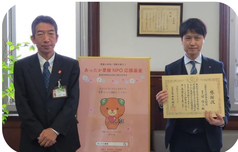
12月23日 公益財団法人関奉仕財団 様