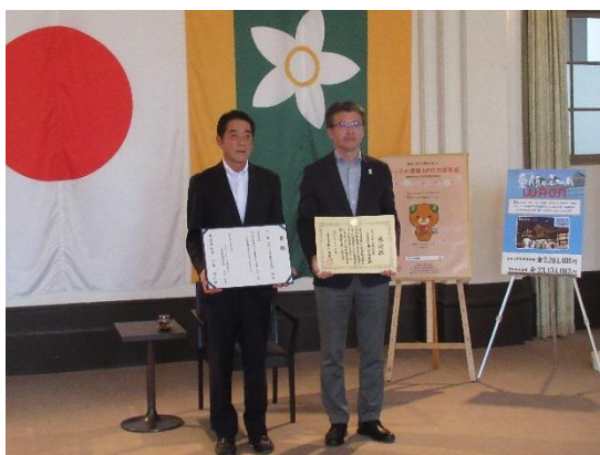
イオンリテール株式会社 様