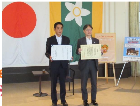
マックスバリュ西日本株式会社 様