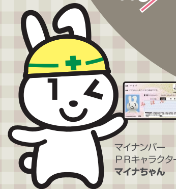
マイナンバー PRキャラクター マイナちゃん