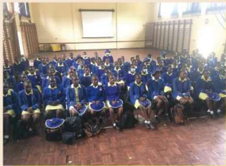
女子高の音楽科。生徒 98 人に音楽の先生一人。楽器は使えるものはほぼありません。