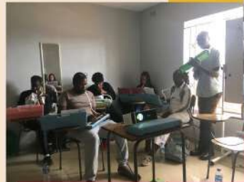
研修の様子。現地講師となる先生が教えてます。