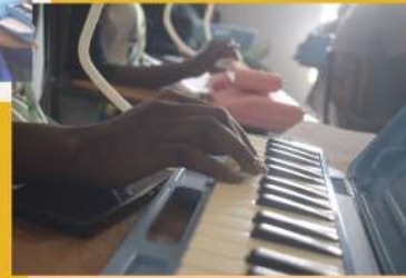
音楽を奏でるって楽しい!