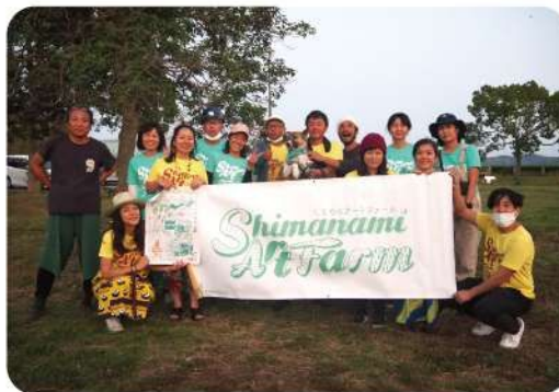
昨年の大三島でのイベントにて