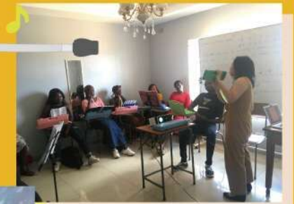
ジンバブエでの研修の様子

領収書は、メールアドレス宛に送付させていただきますが、郵送をご希望の方はその旨お知らせください。