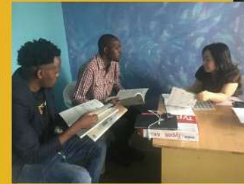
音楽の先生を育てる講師となる先生たち