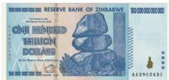
世界遺産でもあるビクトリア滝 インフレ時に発行されたお札。0 がいっぱい。👀!