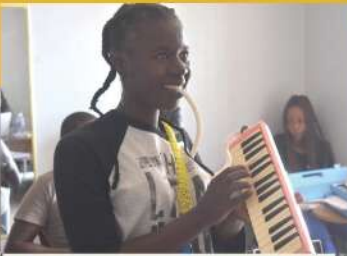
生徒の女の子も楽しそうですね!