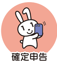
確定申告 (2024年度より)