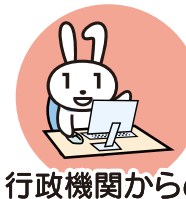
行政機関からの お知らせ・各種証明書