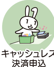
キャッシュレス 決済申込