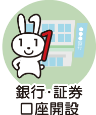
銀行・証券 口座開設