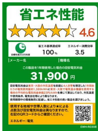
(電気温水機器のイメージ)

※温水機器以外は、製品のサイズやネット取引等の限られたスペースで使用する場合は右側のミニラベルを活用すること。