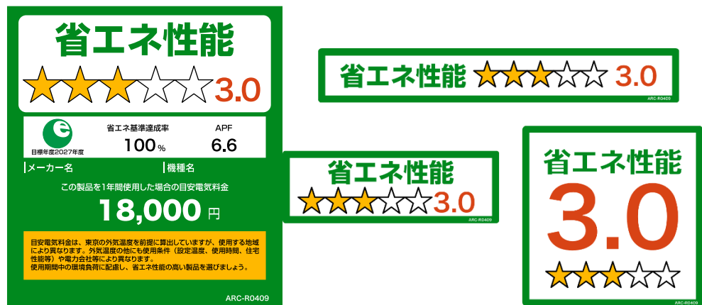
(家庭用エアコンディショナーのイメージ)